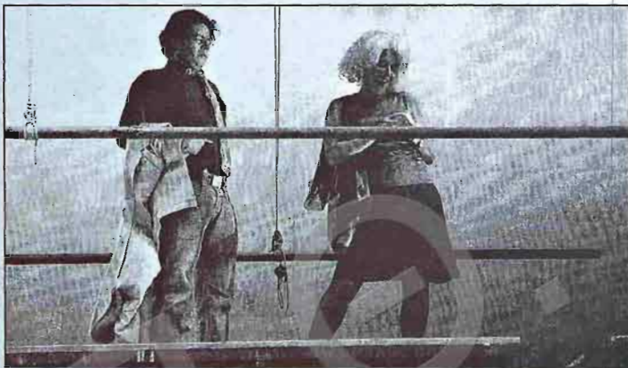
Η ανεμοδαρμένη ταράτσα ενός πολυώροφου κτιρίου γραφείων, στην οποία ανεβαίνουν κλειστά οι εργαζόμενοι για να ζυγώσουν από την πίεση της δουλειάς, δεν είναι απλά ο χώρος της δράσης αλλά το δομικό επίκεντρο της παράστασης.

Επιτρέποντας μια φανταστική απόδραση στο πλαίσιο της πεζής καθημερινότητας και σε συνδυασμό με την παρατεταμένη ανομβρία που ηλεκτρίζει την ατμόσφαιρα, η παράσταση-σκηνή λειτουργεί ως αντίπτυγμα ψυχικών τοπίων αλλά και ως καταλύτης που πρωτογενικά θα επιτρέψει να αναβλύσουν πίσω από τους στοιχειώδεις ανθρώπινους τύπους, αληθινού χαρακτήρα. Κινδυνεύοντας διορκώς να απολέσουν τη σωματική αλλά και την εύθραυστη θυματική τους ισορροπία, οι ήρωες ανεβοκατεβαίνουν από τα γραφεία τους στην ταράτσα και αντίστροφα, καπνίζουν και φιλοσοφούν ακατάχετα, οραματίζονται ήττες και ήττες, μετεωρίζονται ανάμεσα στον αέρα και στα βράβια της ύπαρξης. Πάνω σε αυτόν τον κίβωτο όζωνα κίτζει το αγωνιστικό σύμπαν του ο Μπελμπέλ και με μια μελετηρήνα ανάλαφρη νοσηρότητα απεικονίζει μια κοινωνία δυσανεκτικών της ζωής, πλασματικών γελοίων αλλά αξιολύπτων, σακατεμένων από την ένταση του σύγχρονου τρόπου ζωής, από τον εξουθενωτικό επαγγελματικό ανταγωνισμό, από τη συναισθηματική και επικοινωνιακή δυστοκία. Αναφέροντας με το ιδιότυπο, στυφό χιούμορ του όλο τον παραλογοισμό της πραγματικότητας, μιλώντας ζητήματα για οικεία με ανόκειους τρόπους, ο συγγραφέας υπονομεύει τα θεαματικά θέατρικά είδη και, παρά το παράγωγο και παράδοξα ευτυχές τέλος, επινοεί στην ουσία μια οικτε-