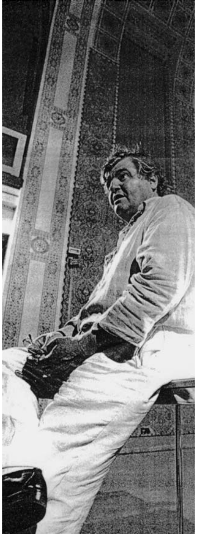
Ο Πέτερ Τουρίνι σε μια ανάγνωση έργων του στη συναγωγή του St. Pölten, 1994.

Όλα αυτά τα χρόνια, ο Τουρίνι, εγκατεστημένος στη Βιέννη, πήρε μέρος σε πολλούς κοινωνικούς και πολιτικούς αγώνες, πάντα με το μέρος των καταπιεσμένων και των κατατρεγμένων. Όσες επιθέσεις κι αν δέχτηκε, παρέμεινε πάντα σταθερός στις αρχές του, αγύριστο κεφάλι, αληθινός δεινόσαυρος, όπως τον αποκάλεσε με θαυμασμό και τρυφερότητα η γνωστή πεζογράφος Ελφρίντε Γέλινεκ.